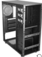
3 پنل جلو و درب های کیس را باز کنید