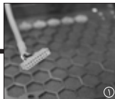
3 کابل ۲۰ پین درگاه USB3.0