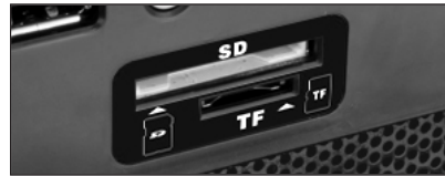
1 درگاه کارت خوان