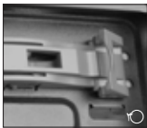
1 ضامن ابزار نصب سریع و آسان را به سمت بیرون بکشید