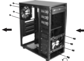
2 فن های ۱۲۰ میلی متری را توسط پیچ در جای خود نصب کنید