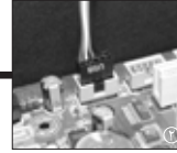
2 کابل USB2.0 را بر روی مادربرد خود نصب کنید