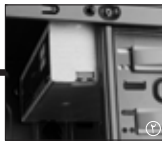
2 درایو نوری خود را از جلو کیس وارد کنید