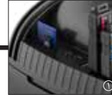
3 درگاه کارت خوان