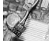
1 کابل USB2.0 اتصال کارت خوان