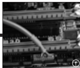
2 کابل ۲۰ پین را بر روی مادربرد نصب کنید