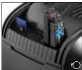
1 درگاه های USB3.0 پنل جلو