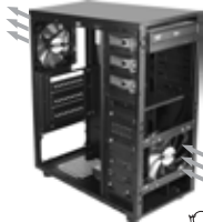
1 جهت صحیح ورودی و خروجی جریان هوا