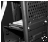
1 جایگاه افقی